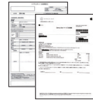
修理報告書 または修理見積書 (コピー可)